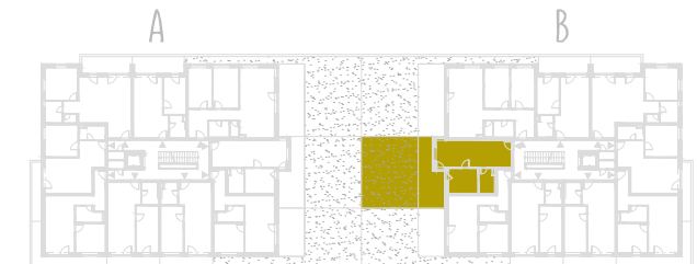
SCHEMA PŔDORYSU 2. NP / SCHEME OF THE SECOND FLOOR