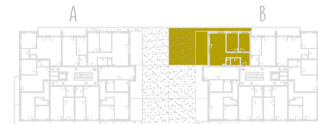
SCHEMA PÔDORYSU 2. NP / SCHEME OF THE SECOND FLOOR