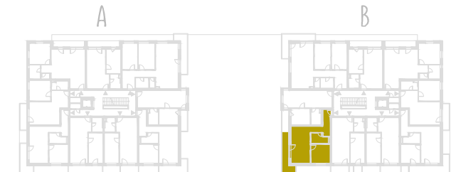
SCHEMA PŔDORYSU 5. NP / SCHEME OF THE FIFTH FLOOR