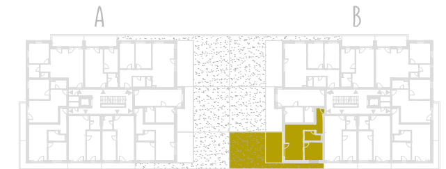
SCHEMA PÔDORYSU 2. NP / SCHEME OF THE SECOND FLOOR