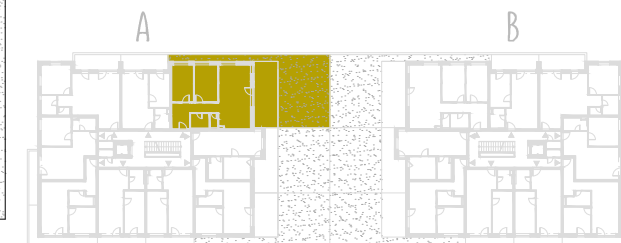
SCHEMA PŔDORYSU 2. NP / SCHEME OF THE SECOND FLOOR