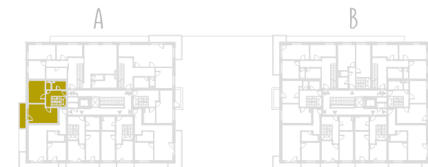
SCHEMA PÔDORYSU 8. NP / SCHEME OF THE EIGHTH FLOOR