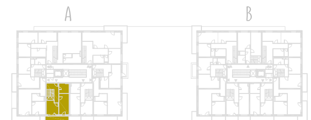
SCHEMA PÔDORYSU 8. NP / SCHEME OF THE EIGHTH FLOOR