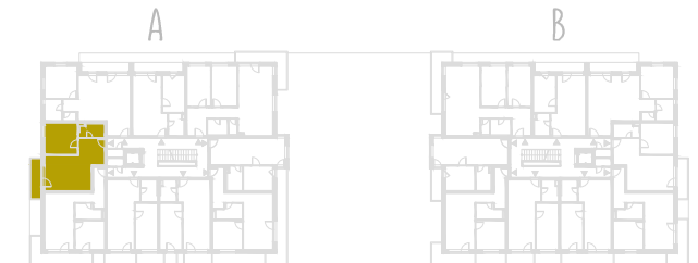
SCHEMA PŮDORYSU 6. NP / SCHEME OF THE SIXTH FLOOR