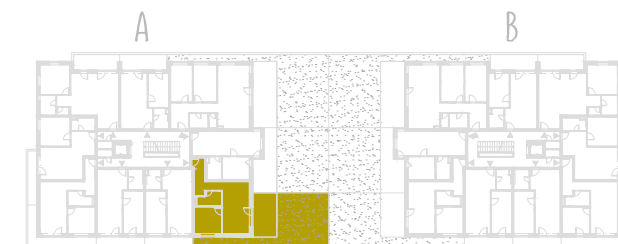
SCHEMA PÔDORYSU 2. NP / SCHEME OF THE SECOND FLOOR